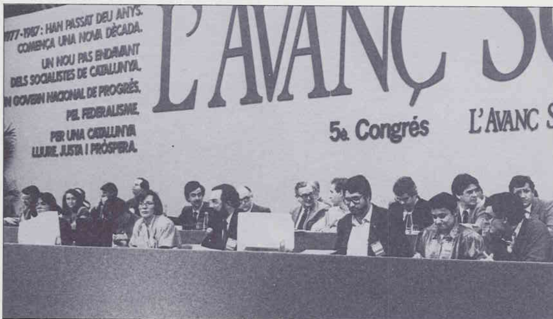
La unitat i la solidaritat van presidir un congrés caracteritzat pel debat intens i extens.