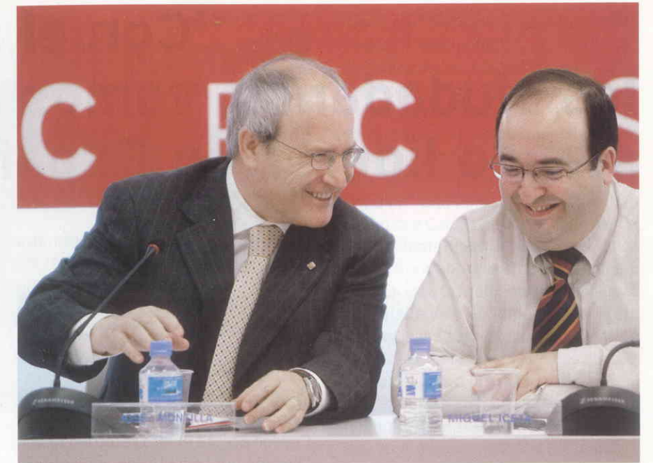
Montilla amb Miquel Iceta, portaveu del PSC