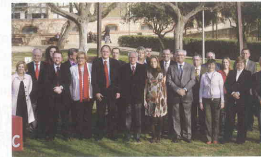
Foto oficial de la candidatura