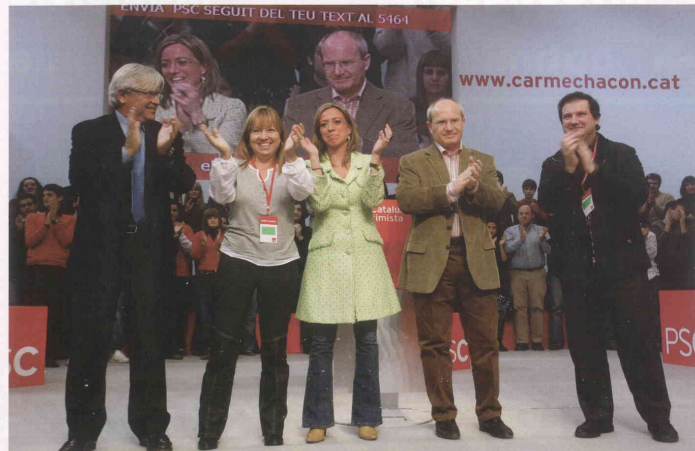
Joan Clos, Manuela de Madre, Carme Chacón, José Montilla y Jordi Hereu

Pero la derecha catalana prefiere poner sus intereses políticos por encima de los intereses de nuestro país, y por eso votan no, "aunque al final la factura la acabe pagando Catalunya." ■