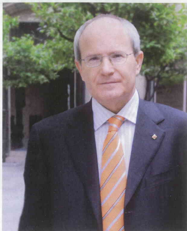
José Montilla, President de la Generalitat

Aquests problemes vénen a constatar dues coses. Per un costat, la incapacitat dels governs de CiU de decidir amb visió de futur quina havia de ser la Catalunya del segle XXI -i no només pel que fa a les infraestructures-, i per l'altre, que haurà de ser un govern d'esqueres qui posi fil a l'agulla, qui resolgui els problemes del passat, qui dissenyi -malauradament amb anys