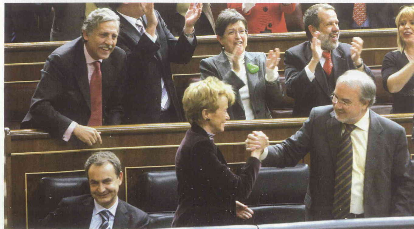
Moment en què s'aprovaren els comptes.