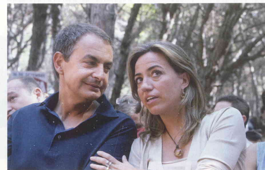
José Luis Rodríguez Zapatero i Carme Chacón

Tot i que, tal i com ha comentat el Secretari d'Organització del PSC, “cal continuar alerta” doncs, de cara a les properes eleccions del 9 de març ens trobarem amb una cita en la que caldrà escollir “cara o creu: Zapatero i mirar endavant, o Rajoy i retornar al passat”.