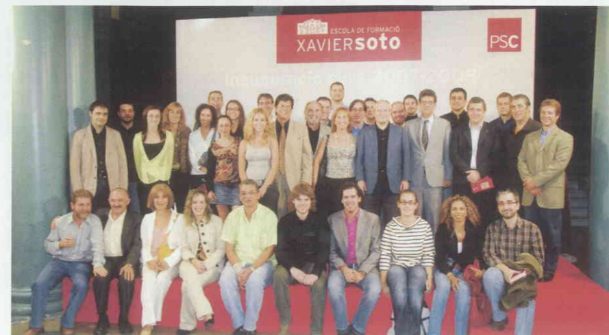
Equip de l'Escola Xavier Soto