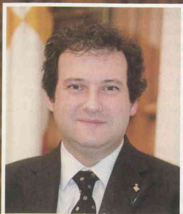
Entrevista amb Jordi Hereu, Alcalde de Barcelona