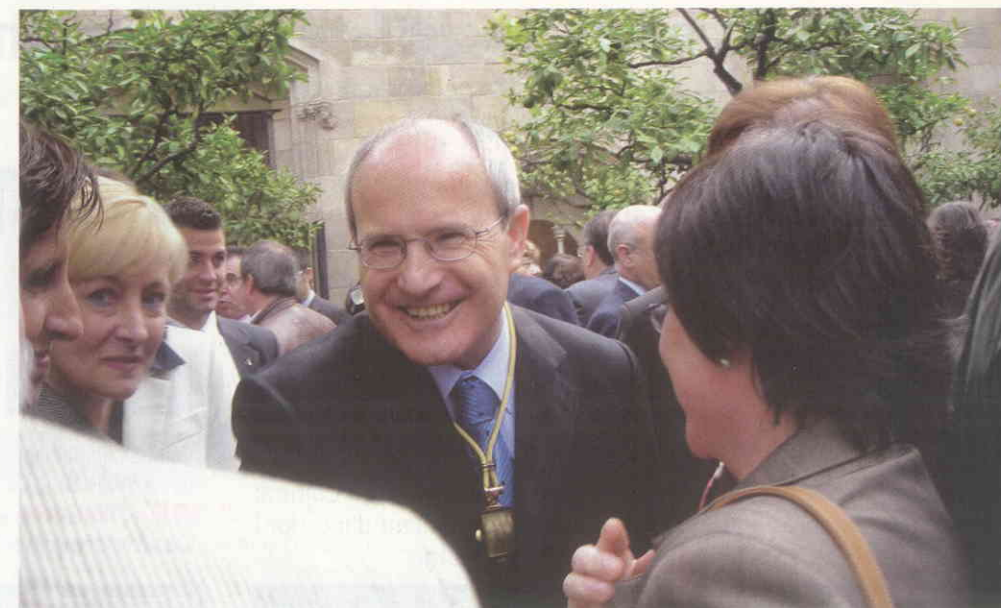
Després de l'acte va tenir lloc una petita celebració en la que Montilla va mostrar la seva vessant més afable.

Montilla va voler deixar clar els seus plans de cara al futur de Catalunya: “Necessitem una acció de govern eficient, que tingui com a objectiu crear les complicitats socials, econòmiques i culturals necessàries. Necessàries per desenvolupar-nos i créixer com a societat moderna, lliure, culta, solidària,