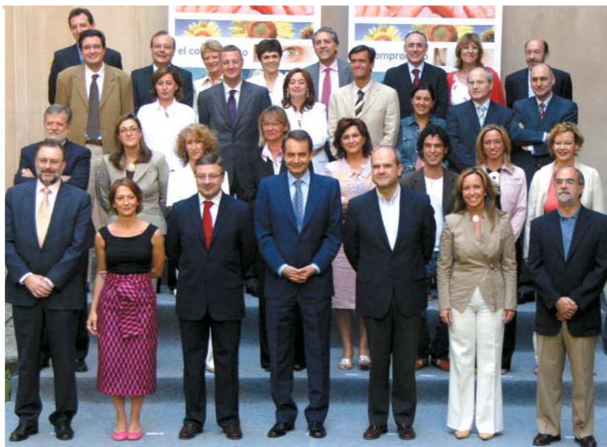
La nueva ejecutiva federal del PSOE.

El 36 Congreso Federal, celebrado en Madrid el primer fin de semana de julio, ha servido para certificar el acierto que supuso hace cuatro años el optar por la línea política de oposición útil y de alternativa rigurosa encabezada por José Luis Rodríguez Zapatero. Una estrategia que han refrendado en las urnas los electores en los sucesivos comicios celebrados. Así lo entendieron también los delegados y delegadas, que aprobaron por unanimidad el informe de gestión que presentó el