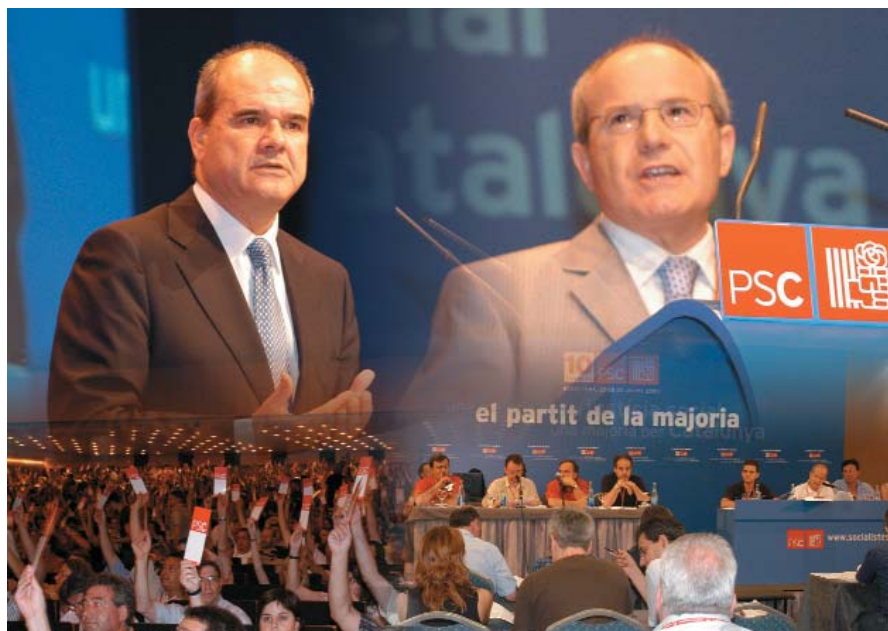
Chaves i Montilla a la cloenda.

socialistes catalans. Tots dos, Lluçh i Raventós, van rebre una llarga ovació de l'auditori del Palau de Congressos amb tots els participants posats dempeus.