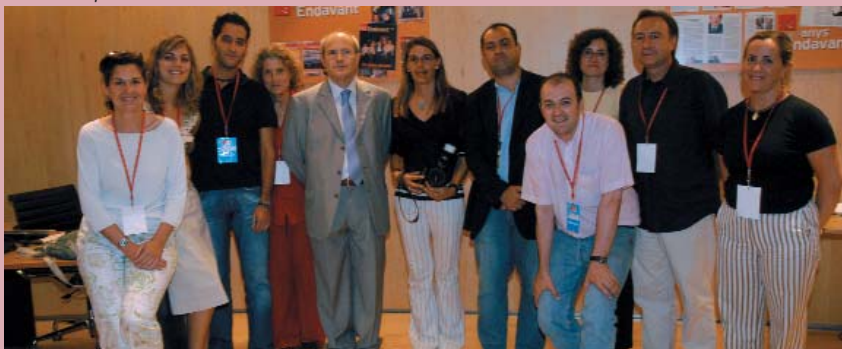
La redacció de l'Endavant digital amb José Montilla