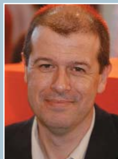
Organització i Finances José Zaragoza