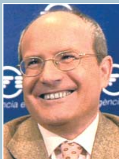
Primer Secretari José Montilla