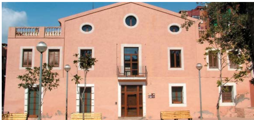
La seu de l'Escola de Formació