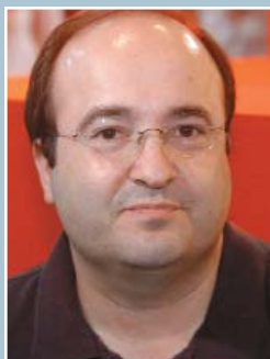
Viceprimer Secretari i Portaveu Miquel Iceta