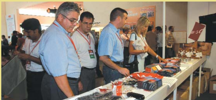
Botiga del PSC

La botiga del PSC al Congrés va aconseguir seduir els delegats i convidats amb els seus productes. Entre els objectes més venuts destaquen les bosses amb el somriure de Josep Borrell, les samarretes i les llibretes. També van tenir molt bona acceptació els micos de peluix amb les sigles del PSC i les tasses. El primer dia, però, es van exhaurir els vanos. Uns aparells d'aire acondicionat que no anaven massa bé en van ser el motiu. ■