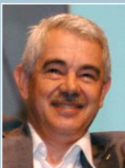
President Pasqual Maragall