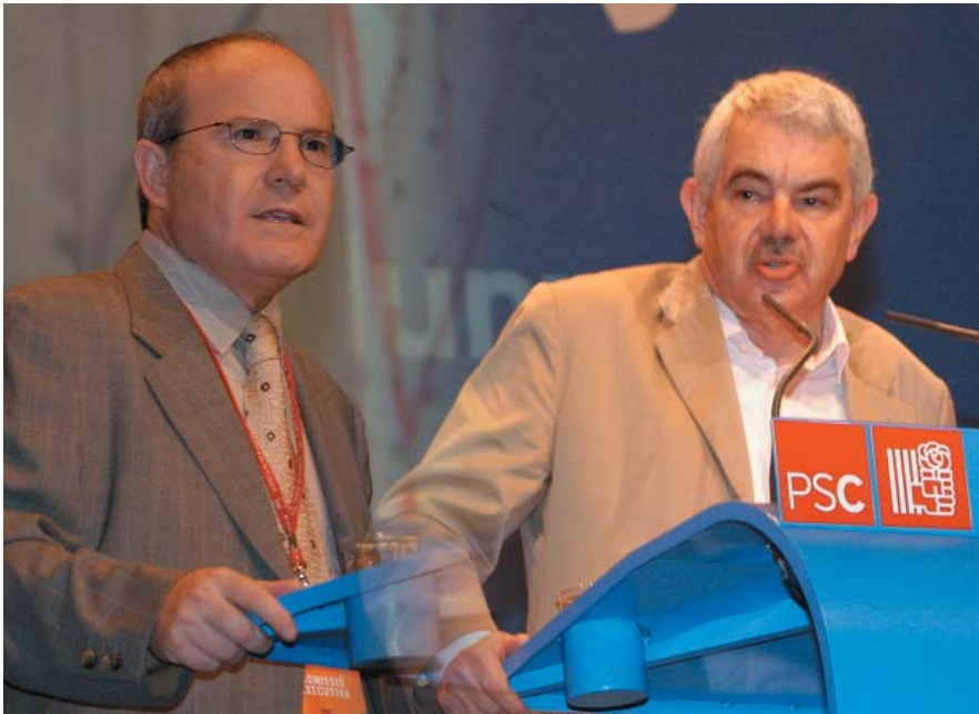
Montilla i Maragall en la intervenció del primer dia.

Satisfacció, però no autocomplaença. Amb la bona feina feta al desè Congrés -celebrat a Barcelona els dies 23, 24 i 25 de juliol-, el PSC encara el futur amb una direcció renovada, amb un missatge polític innovador i amb el compromís de fer realitat totes les esperances que han dipositat en nosaltres una gran majoria de catalans i catalanes. El catalanisme, el federalisme, l'uropeïsmes i la justícia social continuen sent la guia de la nostra acció política.