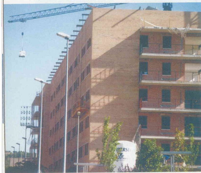
Con el PP, el precio de los pisos se ha puesto por las nubes

En la actualidad, se calcula que las personas que compran un piso deben destinar un 45 % del salario al pago de la hipoteca