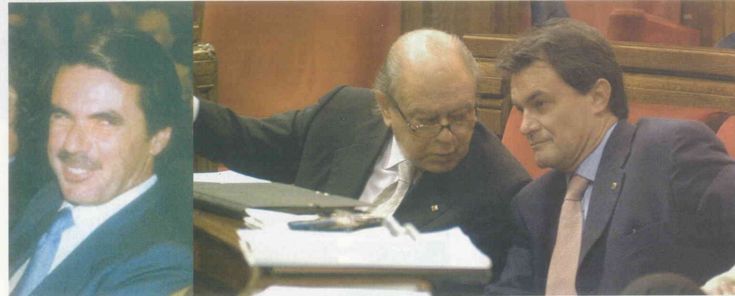
Aznar, Pujol i Mas socis polítics