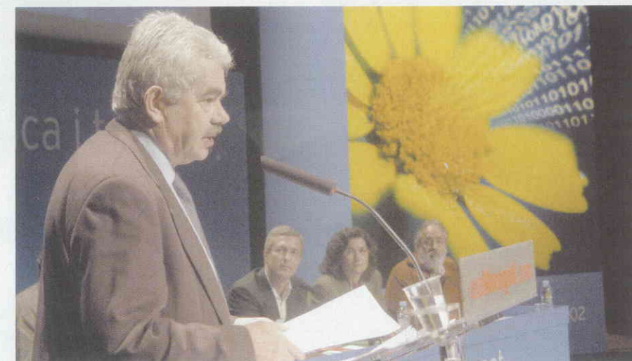
Pasqual Maragall va intervenir en la cloenda

Els dies 23 i 24 de novembre es va celebrar a Tarragona la II Conferència Nacional, dedicada aquesta vegada a Estratègia Econòmica i Territori . Els més de 600 delegats assistents, entre els quals hi havia una destacada presència de simpatitzants i independents, van debatre i aprovar una de les peces fonamentals de l'agenda política del govern del canvi.