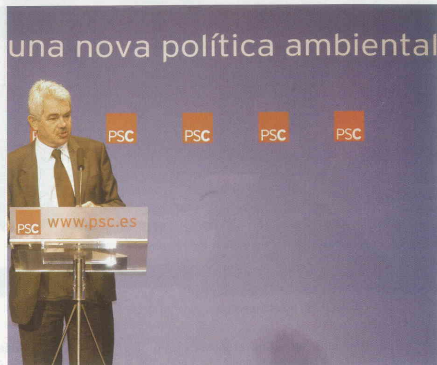
Maragall a l'acte de presentació a Santa Coloma de Gramanet

Catalunya ha d'adoptar una estratègia pròpia per al desenvolupament sostenible. En aquesta línia, Maragall va presentar el 13 de novembre a Santa Coloma de Gramanet una nova política mediambiental -el seu setè compromís- que farà compatible la preservació de la diversitat biològica i la conservació dels nostres recursos naturals amb l'activitat i el progrés econòmic.