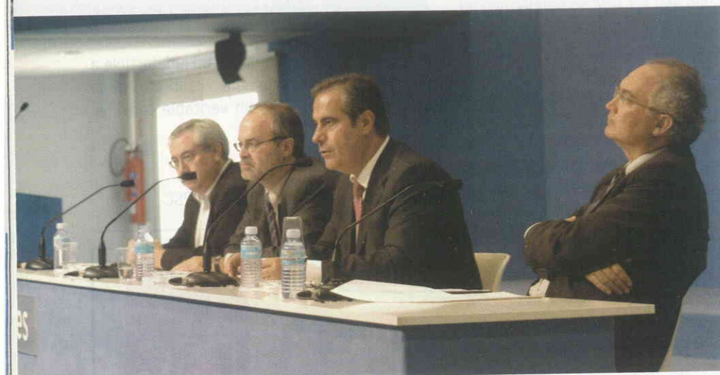
Reunió d'alcaldes i regidors d'hisenda a la seu central