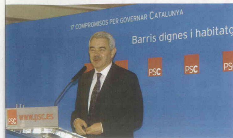
Acto de presentación del compromiso del PSC sobre vivienda

están realizando una política efectiva sobre vivienda que consiga frenar este avance imparable de los precios. Recientemente, el Govern de la Generalitat ha lanzado una propuesta tan original como inconsciente: ayudar fiscalmente a los padres que compran pisos a los hijos. Se trataría de que los padres que ayuden económicamente a sus niños menores de 32 años en la compra de un piso puedan deducir un 1 % de estos gastos de la declaración de renta.