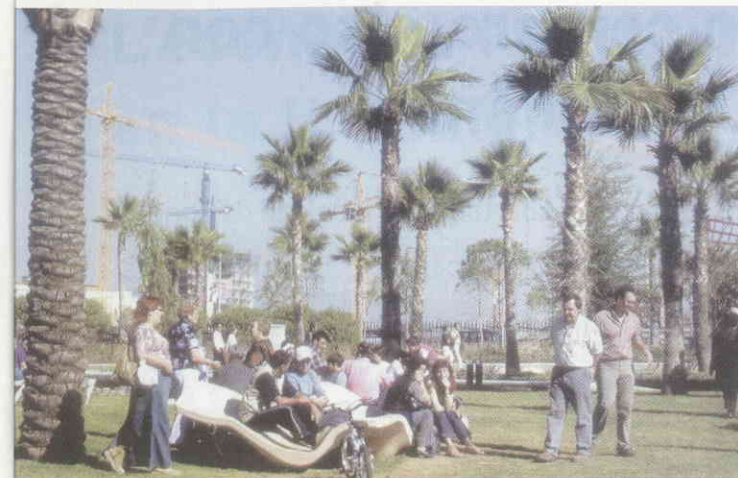
La ciutat de Barcelona és un exemple de gestió sostenible

Per això creiem que cal que Catalunya adopti una estratègia pròpia per al desenvolupament sostenible a través d'un gran pacte entre la societat civil i les administracions públiques, que impregni de forma transversal totes les polítiques que s'han d'aplicar en els propers anys, i