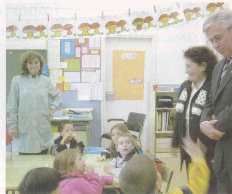
Inauguració d'una de les noves escoles bressol de Barcelona