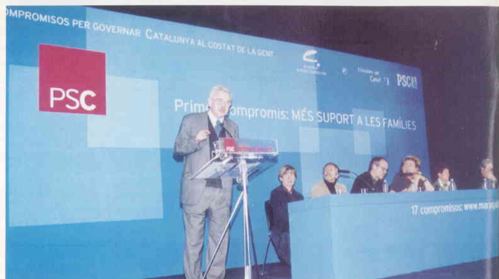
Pasqual Maragall a l'acte de presentació dels compromisos amb les famílies

La família ha estat una paraula llargament recurredada per Convergència i Unió, la Generalitat de Catalunya i Jordi Pujol. Durant dècades l'han fet servir per justificar polítiques conservadores, sovint retrògrades i desfades, i per fer caure en el nucli familiar les responsabilitats de la manca d'inversió de la Generalitat.