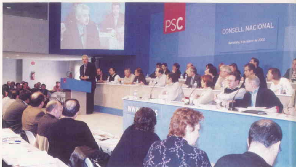
Pasqual Maragall durant la seva intervenció

Entramos en la fase decisiva de cara a las autonómicas. CiU sostiene a un gobierno incompetente y arrogante, que sólo aspira a ganar tiempo para dar a conocer al aprendiz de Pujol y escenificar un falso distanciamiento con el PP. Hay que seguir trabajando por aumentar nuestra implantación municipal y seguir llevando nuestras propuestas hasta el último lugar de Catalunya.