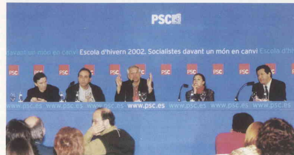
Josep Borrell va moderar una de les taules rodones

Pasqual Maragall, en la seva intervenció inaugural, va manifestar que cal apostar per "una altra concepció de la globalització" ja que "els canvis a nivell mundial no es poden deixar només en mans dels mercats". Per a Maragall, cal perseguir "una nova normalitat" sense repetir els errors que han provocat la crisi.