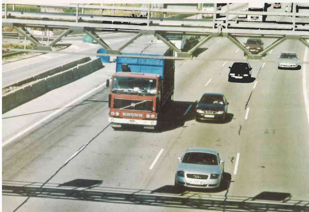
S'han d'eliminar alguns trams de peatge a Catalunya.

Els socialistes volem un sistema de peatges més just, que ens homologui