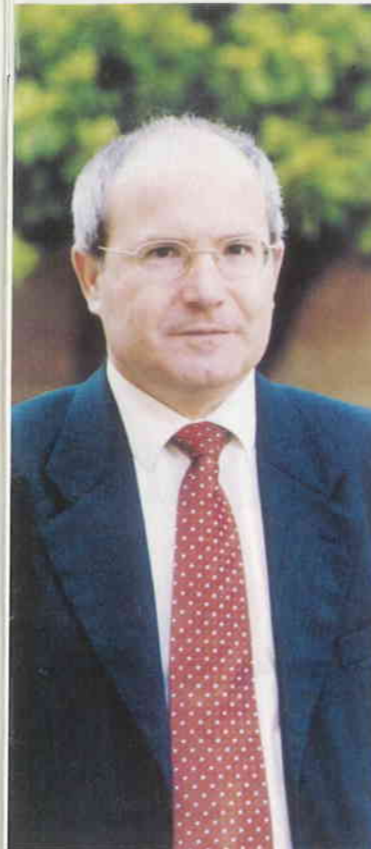
José Montilla Primer Secretari del PSC

Les últimes enquestes -les publicades i les no publicades- confirmen una tendència a l'escenari polític de Catalunya. El PSC es consolida com la força més votada, el nostre candidat és el més preferit per la ciutadania, està ben valorat i Mas no resisteix cap comparació amb Pasqual Maragall. Però que anem en la bona direcció no vol dir que haguem arribat a la meta. En primer lloc, Mas, malgrat no ser un candidat ben valorat, ha guanyat en coneixement, com a conseqüència directa de la campanya electoral que ha iniciat la coalició nacionalista. El comitè de campanya de CiU, o sigui el Govern de la Generalitat, està fent tot el possible per recolzar el paper protagonista del seu Conseller en Cap i candidat. CiU no té cap escrúpol en utilitzar totes les eines al seu abast, mitjans de comunicació, propaganda institucional, el propi govern, etc., per afrontar les properes eleccions autonòmiques. En segon lloc, els socialistes no ens podem conformar amb una diferència de quatre o cinc punts. Això no és garantia que podrem aplicar el nostre programa de govern. Els socialistes volem fer realitat el programa del canvi i per aconseguir aquest