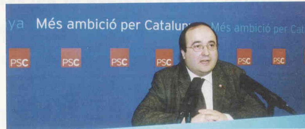
Miquel Iceta, portaveu del PSC

El portaveu del PSC, Miquel Iceta, va manifestar en roda de premsa que "els socialistes entenem els nervis de Convergència i Unió. Els entenem bé perquè Convergència i Unió ha traït novament els interessos de Catalunya. Ho va fer al Parlament Europeu votant a favor del Pla Hidrològic Nacional. Ho va fer al Parlament de Catalunya votant en contra d'atribuir a la Generalitat el comanda-