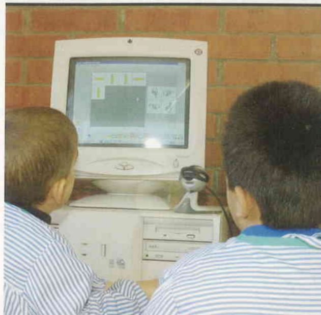
Hay que invertir más en educación

La enseñanza es una de las principales garantías de la igualdad de oportunidades entre las personas. Hoy, el Partido Popular promueve, a través de sus propuestas de reforma educativa, que sean sólo unos pocos los que gocen de una buena educación, por lo que existe una gran preocupación en la comunidad educativa por la situación en que se encuentra el sistema docente.