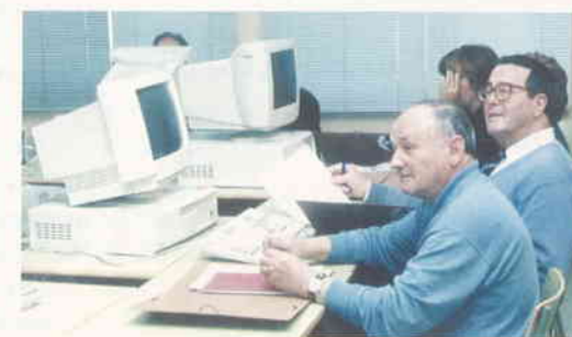
La Gent Gran vol més que paraules del Govern

6. Millora d'habitatges. El PSC creu que es podrien arranjar 100 habitatges per any, amb un cost de 6.000 euros cadascú.