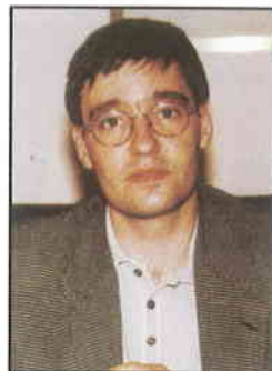
► Salvador Illa.

Cuatro concejales tráfugas y tres procedentes de la lista de una urbanización llamada La Torreta (ILT), derribaron a principios de febrero el gobierno municipal presidido