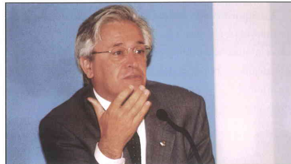
► Clos va explicar a Jospin la importància de l'AVE per a Barcelona.

L'alcalde de Barcelona, Joan Clos, va entrevistar-se al principi de febrer amb el primer ministre francès, Lionel Jospin, per tal d'explicar-li que, per Barcelona i tot l'arc nord del Mediterrani, és bàsic disposar del tren d'alta velocitat per tal d'equilibrar el pes que avui té l'eix industrial del nord d'Europa. Per a l'alcaldia de Barcelona és bàsic mantenir la pressió davant els governs francès i espanyol, per tal que la comissió intergovernamental Espanya-França, que se celebra aquest mes de març, confirmi els compromisos adquirits. L'alcalde Joan Clos va aprofitar el viatge a París per participar en una festa míting, organitzada per la Federació Socialista de París, amb motiu de l'inici de la precampanya de les eleccions europees. Clos va prendre la paraula al costat del mateix Jospin, l'exprimer ministre Michel Rocard i el primer secretari del PSF, François Hollande, per cridar els seus companys de partit a "construir una Europa encara més forta" i per recordar que a Espanya les eleccions