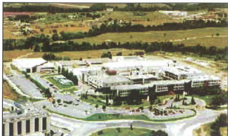
► Centro de TVE en San Cugat.