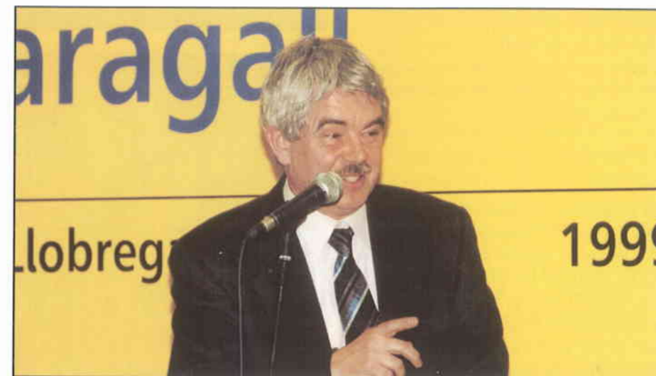
► Cada cop hi ha més gent que dona suport a Maragall.

En conjunt, més de 15.000 afiliats del PSC, més de 13.000 simpatitzants enregistrats i més de 31.000 ciutadans i ciutadanes que encara no eren militants ni simpatitzants van participar a les eleccions primàries i van posar de manifest que aquest procediment és útil i que troba una molt bona acollida per part de la ciutadania. Carrers, places, cantonades, col·legis i centres cívics de tot Catalunya es van omplir de gent que volia donar un suport explícit a Pasqual Maragall. Des d'ara tenim 60.000 activistes de la campanya del canvi. Si cadascuna d'aquestes persones aconsegueix el vot de 25 electors tenim guanyades les eleccions. Necessitem, tal com va dir Maragall al Consell Nacional, entre 1'2 i 1'4 milions de vots a les autonò-