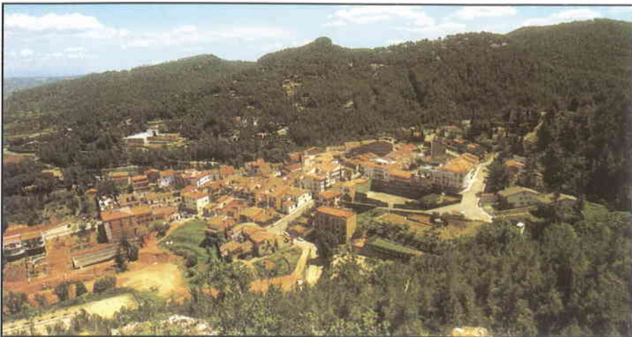
► Molts pobles de Catalunya seran governats per plataformes progressistes.

La Comissió Executiva del partit ha decidit obrir les llistes municipals socialistes a les plataformes locals progressistes. D'aquesta manera, a les properes eleccions municipals del 13 de juny, el PSC podrà formar coalició amb grups progressistes en aquells municipis on s'arribi a un acord. La llista haurà d'incloure el nom del PSC i s'adaptarà a les possibilitats de cada població. Segons el secretari de Política