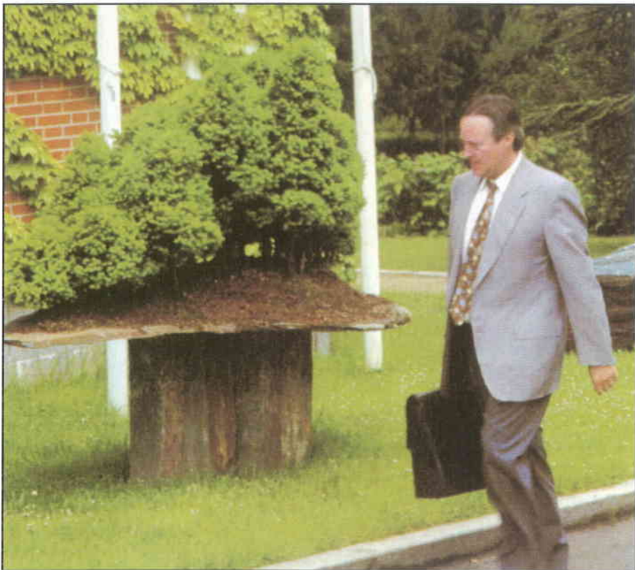
► Amaga alguna cosa Josep Piqué a la maleta?

Ni el ministre Piqué ni Loreto Consulting han declarat cap de les operacions comercials que van mantenir amb l'empresa Ercros. No surten els 115 milions que aquesta empresa va pagar a Loreto Consulting per uns pretesos estudis, ni les 550.000 accions d'Ercros que Josep Piqué va adquirir al seu nom. No