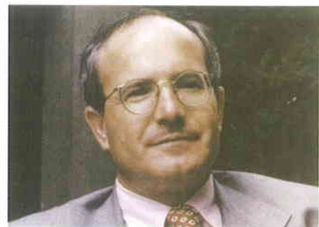
► Josep Montilla.

Coincidiendo con las primarias de las autonómicas, los municipios de más de 20.000 habitantes, y otros de menor población, que no habían elegido todavía a su cabeza de lista para las municipales tuvieron ocasión de hacerlo. En Cornellà, el alcalde y secretario de organización del PSC Josep Montilla consiguió 1220 votos a su favor. De ellos 890 fueron simpatizantes (94% a favor), ya fuera censados o no censados, y 330 militantes (99%).