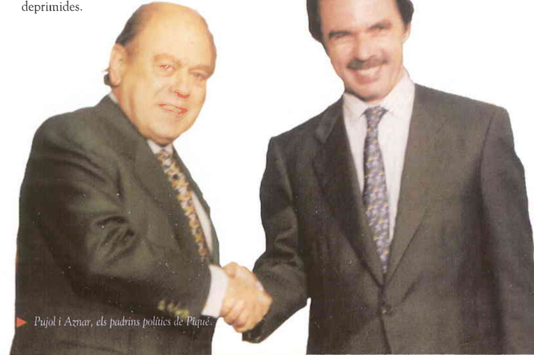
► Pujol i Aznar, els padrins polítics de Piqué.