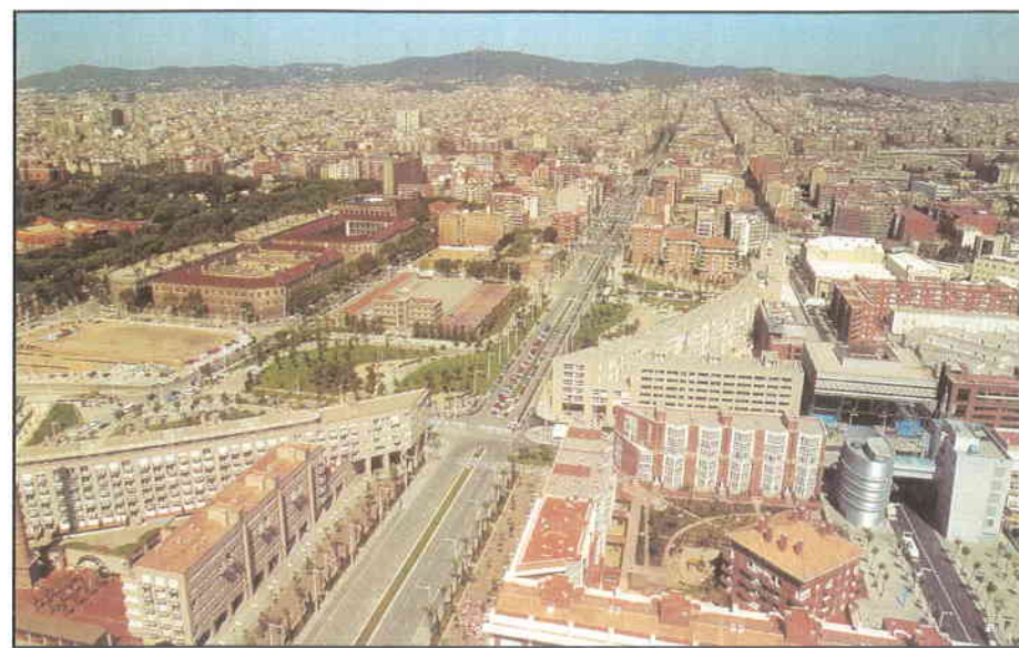
► Barcelona és un gran exemple de les polítiques municipals socialistes.

gonistes de la prestació de cultura, educació i serveis socials als ciutadans i ciutadanes han estat els ajuntaments, que han facilitat serveis descentralitzats, de proximitat, eficients i amb control i participació democràtics. D'aquesta manera, els municipis han fet una tasca important, que ha suplert amb eficàcia els serveis que havien de prestar altres administracions públiques, i sobretot la Generalitat. El cas més flagrant de serveis supletoris, i que en els darrers temps està de molta actualitat, és el de les residències per a la gent gran, àmbit en el qual les corporacions locals catalanes gestionen més de 120 residències, amb més de 4.000 places, la