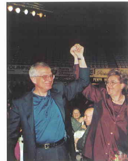
► Josep Borrell y Maite Arqué.

Por su parte, Maite Arqué, hizo en su parlamento un repaso a los veinte años de transformación democrática de la ciudad desde el Ayuntamiento, señalando como realizaciones más destacadas "la red de servicios públicos, la de saneamiento, las zonas verdes, la recuperación de la playa, los nue-