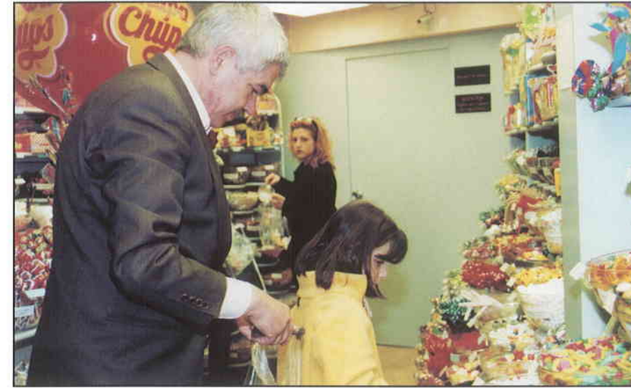
► Maragall, passejant per Barcelona el dia de les primàries, es va aturar un moment per comprar caramels.