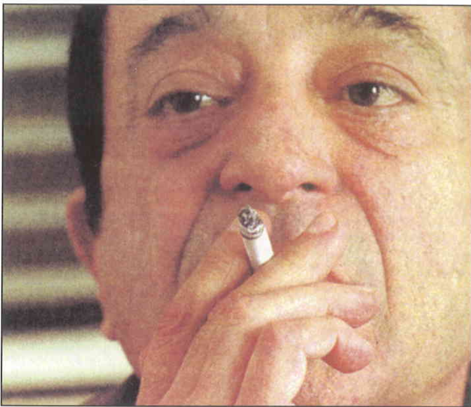
► José Agustín Goytisolo.

Juntament amb Costafreda, Barral i Gil de Biedma van constituir l'anomenada Escola Barcelona, dintre de la qual Goytisolo es va caracteritzar pel seu compromís humà i social. En la seva obra també trobem el reflexe de tota la seva vida, familiar, sentimental, política, literària. Seria impossible fer aquí ni tan sols una lleugera menció de cadascun dels seus llibres des d'aquell primer i excepcional El retorno (1955), fins el més recent Las horas quemadas (1996) o La novísima vida a Barcelona . A mi m'agraden especialment Del tiempo y del olvido (1977) i un llibre que recull poemes dedicats de la seva mare morta en un