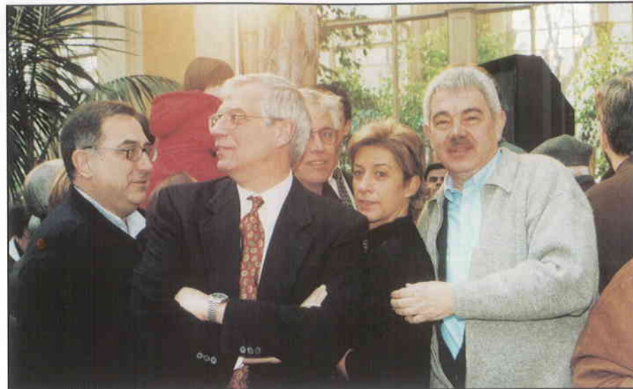
► Festa a l'Hivernacle.

En definitiva, els resultats de les eleccions primàries han permès posar de relleu el desig de participació que comparteix una majoria ciutadana. A la vegada, les prop de setanta plataformes de suport que actuen per tot el territori de Catalunya són una altra manifestació d'aquesta voluntat de canvi. Quan a la premsa local de diverses poblacions es publiquen manifestos amb centenars de firmes, i els signants exposen els seus noms sense cap temor, vol dir que alguna cosa important es mou al país: l'hegemonia s'ha acabat i els ciutadans prenen la paraula. La taca d'oli s'extén dia a dia, les iniciatives a la societat es multipliquen, el canvi es respira a Catalunya.