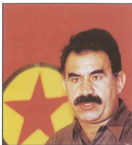
► Abdalá Ocalan.

Las extrañas circunstancias de la detención en Kenia y el posterior traslado a Turquía del líder kurdo Abdul Ocalan han devuelto a la actualidad las vicisitudes de un pueblo, los kurdos, olvidado por la historia. Entre bambalinas, Estados Unidos apuesta por crear un estado en el Kurdistán iraquí, que debilite el poder de Saddam Husein. Washington, habituado a emplear la diplomacia de las cañoneras con Irak, ha abierto un nuevo frente de acoso a Bagdad tras la detención de Ocalan.