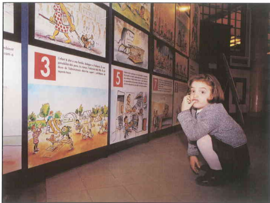
► Els socialistes hem aconseguit unes ciutats amb gran qualitat de vida.

Una concepció del món local per la qual han treballat els homes i dones socialistes que han governat, en els darrers 20 anys, els principals ajuntaments de casa nostra. Una concepció que ha estat validada, des del 1979 i elecció rere elecció, pels ciutadans i ciutadanes de Catalunya, fins i tot en moments tan delicats per al socialisme a Espanya com en les darreres eleccions municipals, l'any 1995, quan el PSC va