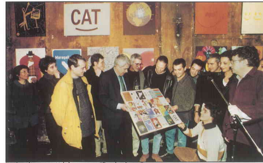
► Acte de presentació de la campanya "Postals pel canvi".