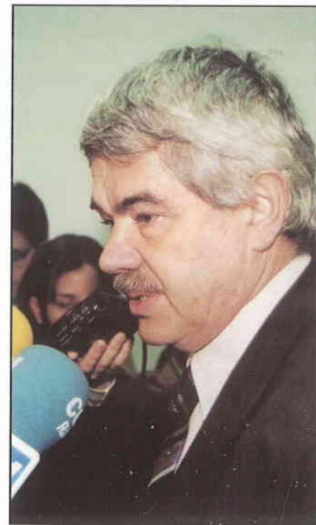
► Pasqual Maragall.