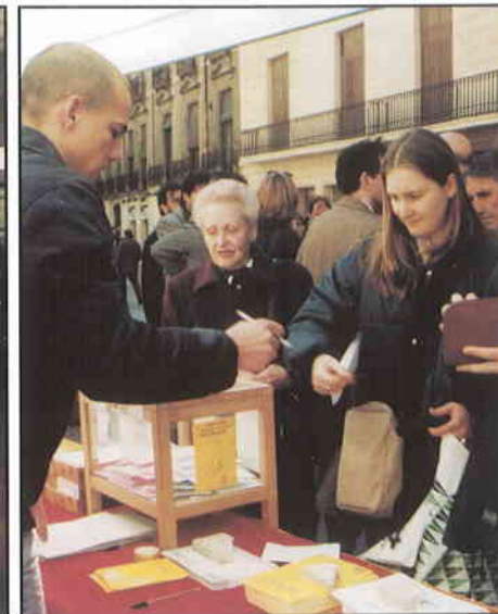
► Una concorreguda mesa al Portal de l'Àngel.