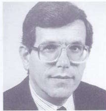
4. MARIÀ GIL I AGNÉ

Nascut al Vendrell, població on viu i de la qual va ser alcalde durant quinze anys. Té 44 anys. És economista. Va ser elegit diputat del Parlament de Catalunya a les eleccions de 1984 i hi és portaveu d'assumptes econòmics del grup parlamentari.