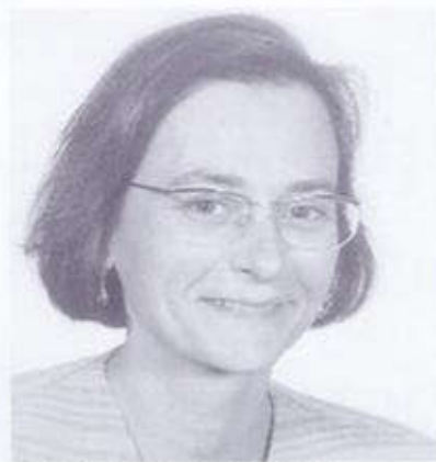
2. MONTSERRAT DUCH I PLANA

Va néixer a Reus ara fa 46 anys. És també la ciutat on viu i de la qual és alcalde des de l'any 1987. Llicenciat en direcció d'empreses i especialitzat en economia agrària. És diputat al Parlament de Catalunya des de l'any 1992. Pertany a la comissió executiva del PSC.