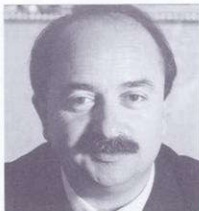
1. JOSEP ABELLÓ I PADRÓ

Va néixer a Reus ara fa 46 anys. És també la ciutat on viu i de la qual és alcalde des de l'any 1987. Llicenciat en direcció d'empreses i especialitzat en economia agrària. És diputat al Parlament de Catalunya des de l'any 1992. Pertany a la comissió executiva del PSC.