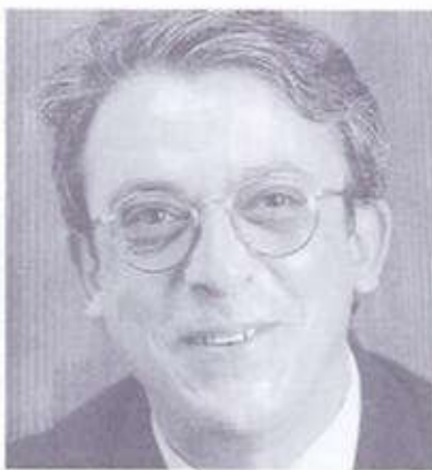
2. DANIEL TERRADELLAS I REDON

És fill de Girona i viu a Serinyà, al Pla de l'Estany. Té 42 anys i és llicenciat en ciències biològiques. Ha exercit de professor de ciències naturals en diversos instituts. És diputat al Parlament des de 1984 i primer secretari de la federació del PSC de les comarques gironines.