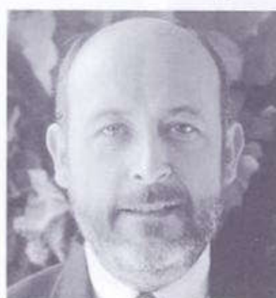
2. RAMON VILALTA I OLIVA

Va néixer a Lleida ara fa 52 anys. És economista. Ha estat alcalde de la seva ciutat entre 1979 i 1987 i de 1989 ençà. Va presidir la Conferència de Poders Locals i Regionals del Consell d'Europa durant dos anys. És membre de l'executiva del PSC i diputat del Parlament des de l'any 1983.