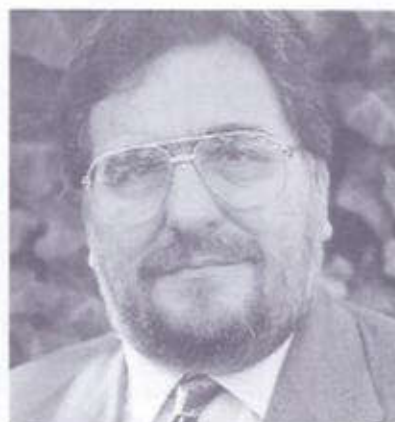
1. ANTONI SIURANA I ZARAGOZA

Va néixer a Lleida ara fa 52 anys. És economista. Ha estat alcalde de la seva ciutat entre 1979 i 1987 i de 1989 ençà. Va presidir la Conferència de Poders Locals i Regionals del Consell d'Europa durant dos anys. És membre de l'executiva del PSC i diputat del Parlament des de l'any 1983.