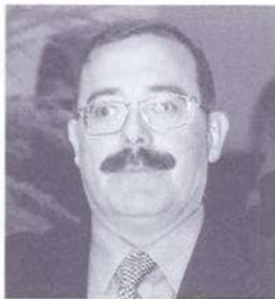
1. MANUEL NADAL I FARRERAS

És fill de Girona i viu a Serinyà, al Pla de l'Estany. Té 42 anys i és llicenciat en ciències biològiques. Ha exercit de professor de ciències naturals en diversos instituts. És diputat al Parlament des de 1984 i primer secretari de la federació del PSC de les comarques gironines.