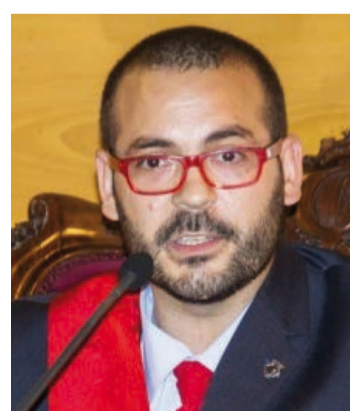
Objectiu per a aquest nou mandat als nostres municipis