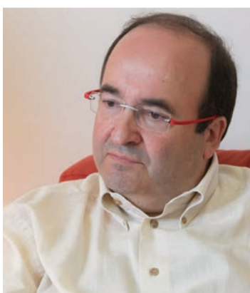
Entrevista p. 02-03