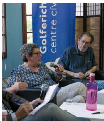
Diàlegs Endavant! p. 04