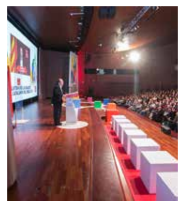
Especial. p. 07 "La Crida"