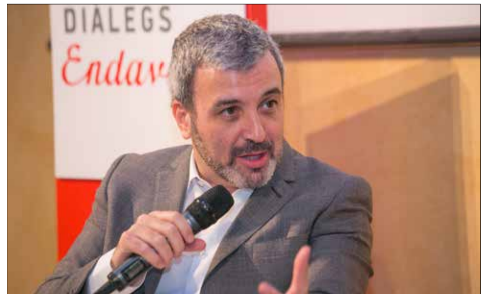
Dialectes Endavant! p. 02-03. Barcelona: Passat, present i futur?