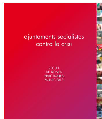
Món local. p. 06