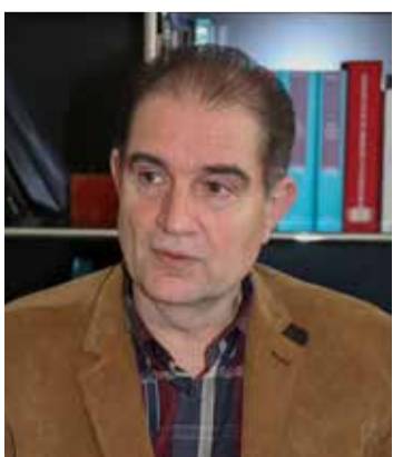
Entrevista p. 04-05