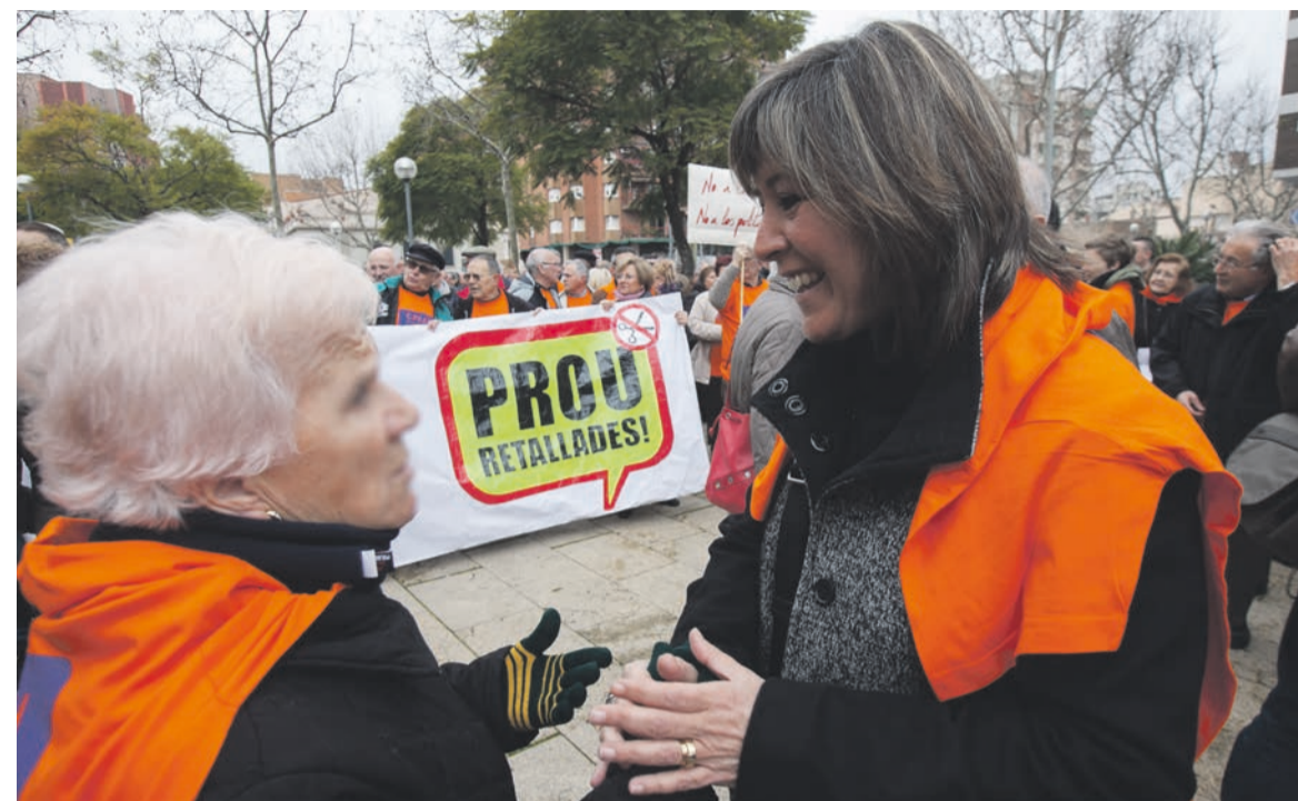
Conversant amb una dona per dir no a les retallades i sí als drets socials i als serveis públics.

Des de l'entrada en vigor de la LRSAL els serveis públics locals i l'autonomia municipal s'han vist atacats frontalment i els governs municipals hem hagut de blindar aquests serveis que especialment protegeixen els més vulnerables: els serveis socials, la dependència, el foment de l'ocupació i l'educació. Els ajuntaments són l'última línia de defensa de l'estat del benestar, per això molts consistoris d'arreu de Catalunya i Espanya hem presentat un recurs d'inconstitucionalitat contra una llei que no és ni oportuna, ni adequada, ni sostenible, ni tolerable.