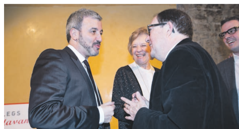
A l'esquerra, el candidat socialista a Barcelona, Jaume Collboni, conversant amb els ponents. A la dreta, el primer secretari del PSC, Miquel Iceta, presentant el primer Diàleg del cicle.