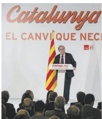
Especial. p. 02-03