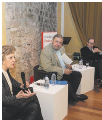
Diàlegs Endavant! p. 04-05