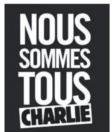
Espanya. p. 07