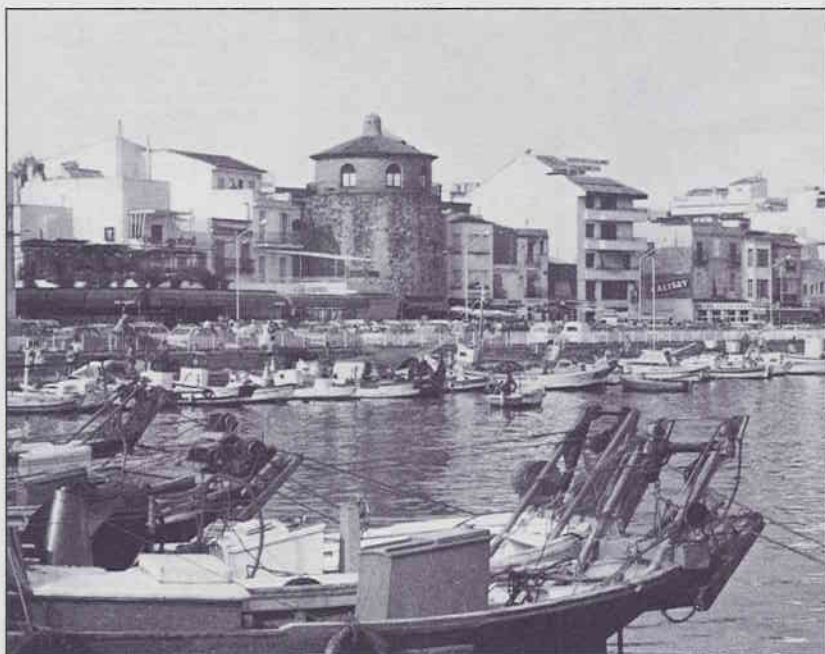
Cambrils és la millor mostra de com no s'ha de construir Catalunya

Tot i els escarafalls que ha fet Convergència contra la Llei de Costes pel conflicte de competències que suposa entre l'administració central, el seu veritable pànic són les mesures de respecte de les platges i el seu entorn que representa. El 86 per cent de les esmenes presentades pel grup de Convergència i Unió a aquesta llei són per suavitzar, posposar o suprimir les prescripcions de protecció que assenyala. El que temen és no poder especular amb les costes del nostre país ara que bufen bons vents pel ram de la construcció. I el que haurien d'ha-