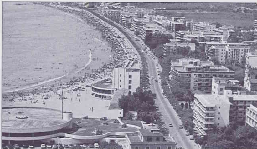
Salou és un dels indrets més afectats per l'arbitrarietat urbanística convergent.