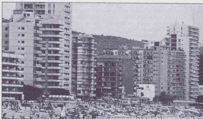
Sembla que hi ha qui vol fer marxa enrera i tornar als temps en què es destruïa la cara costanera de Catalunya

Alts càrrecs del govern de Convergència i Unió són els primers implicats en les irregularitats urbanístiques que amenacen amb malmetre la cara del nostre país. El mateix secretari general de la Presidència de la Generalitat s'ha vist implicat en les irregularitats urbanístiques d'un xalet a Blanes. Tema preocupant però que no ha servit perquè Lluís Prenafeta donés una explicació pública del seu trist comportament en aquest afer. Curiosament, en aquest cas ha estat un municipi governat per CiU el que ha acabat imposant la sanció contra el xalet vinculat a Prenafeta. CiU governa Blanes amb una majoria minoritària. Socialistes i comunistes són a l'op-