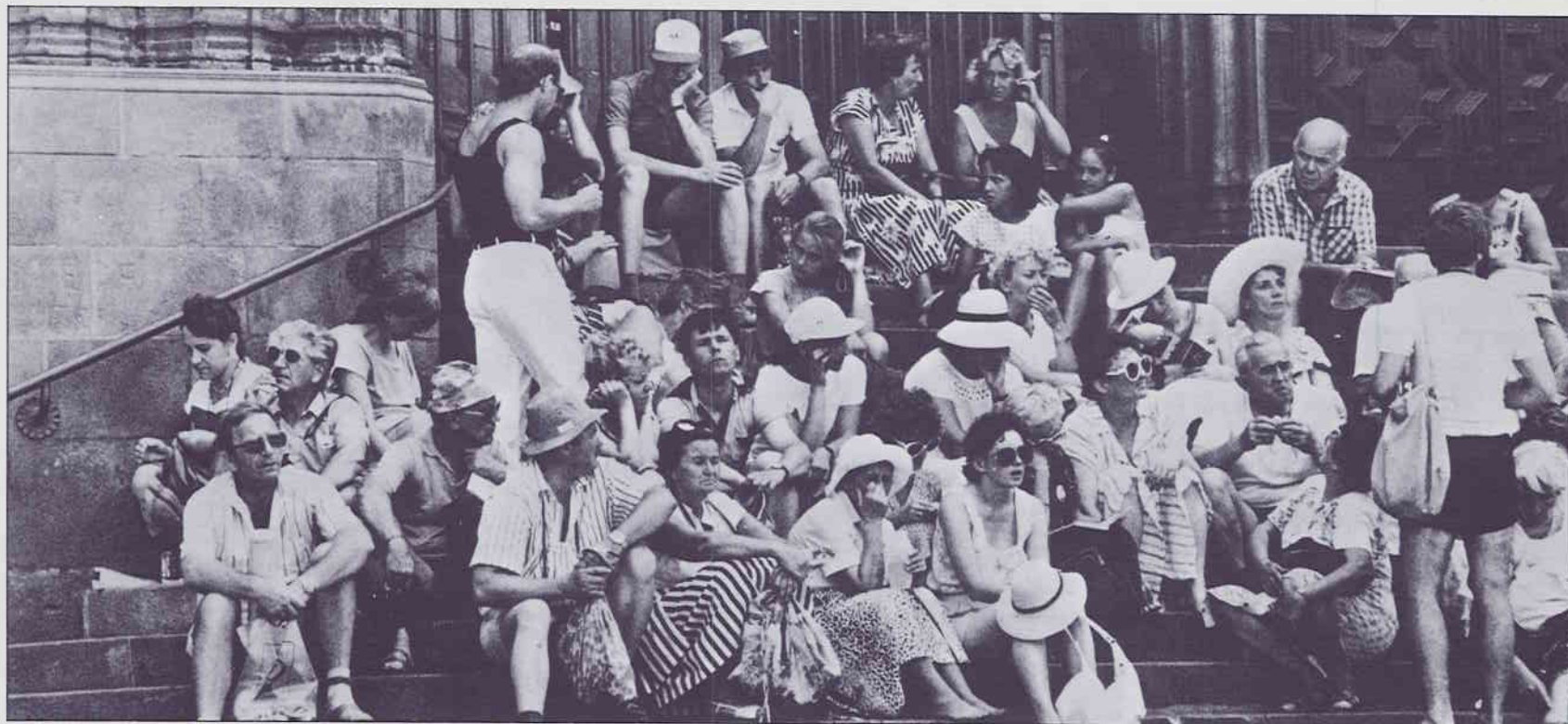
Que hi hagi molts turistes no vol dir que el turisme vagi bé