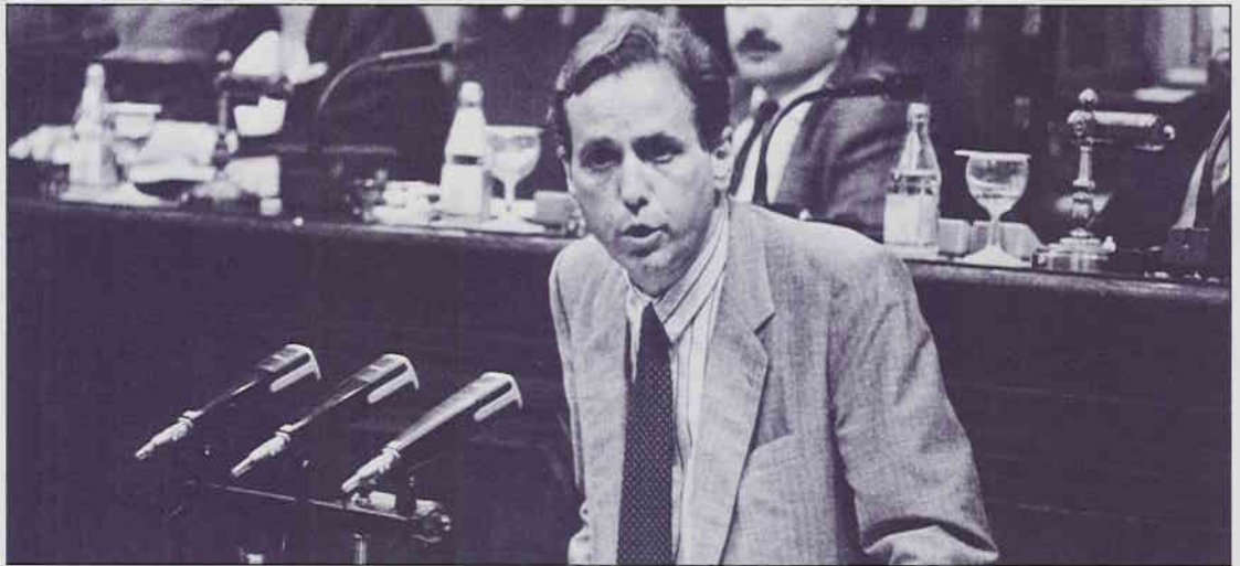
Al govern Pujol no li agrada que el Parlament el fiscalitzi. Per això, l'ignora.

Què diu sobre la ridícula polèmica de l'aplica-