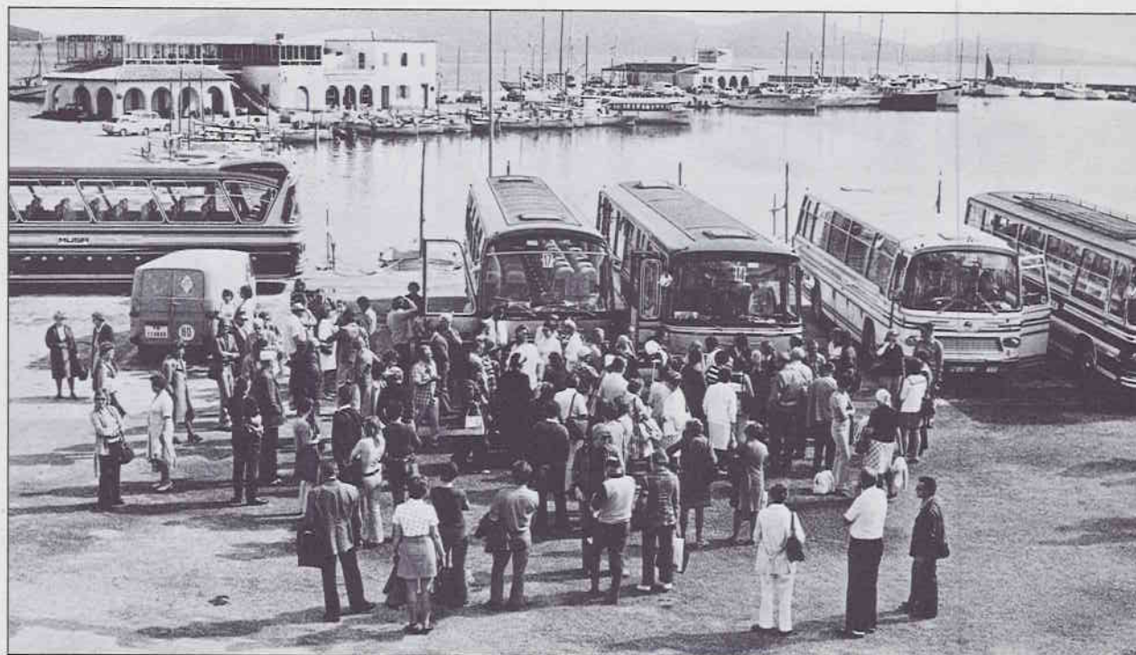
Cal posar-hi coratge, rigor i, d'una vegada, agafar-nos el turisme seriosament

Sort que hi hem arribat a temps i hem tallat el mal d'arrel! Quin desastre es podria haver produït si la gent m'hagués fet cas! Ens podríem trobar com a Mallorca, on sembla que això de creure que hi ha crisi i que s'ha de reconvertir s'ho agafen serio-