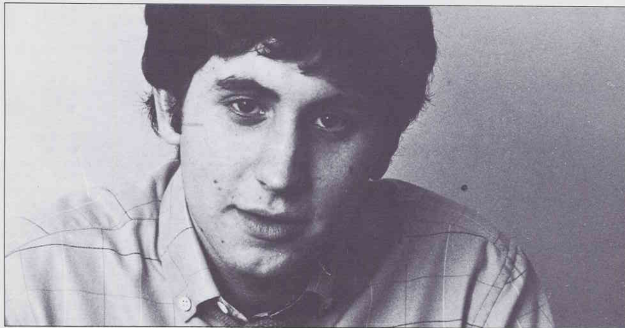
«Desitjaríem més bel·ligerància contra Pujol.»

—Nosaltres, quan ha calgut, hem mostrat les nostres discrepàncies, com va succeir amb el referèndum sobre l'OTAN. Avui, però, estem molt satisfets de la relació amb el PSC, atès que ens sentim identificats amb el seu projecte i amb el lideratge de Raimon Obiols. I si no estiguéssim d'acord ho diríem sense embuts. Potser, això sí, desitjaríem més bel·ligerància contra Pujol.