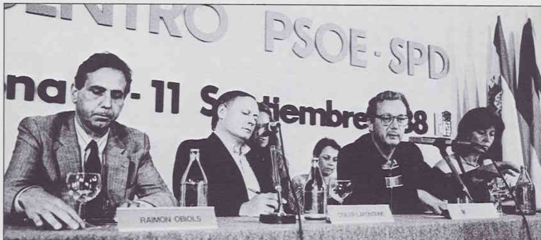
Cal avançar plegats cap a la constitució d'un Partit Socialista Federal Europeu.

Avui, és necessari i urgent avançar plegats cap a la constitució d'un Partit Socialista Federal Europeu, enfortint la Unió de Partits Socialistes de la Comunitat Europea i, més enllà, com acaba d'aprovar el 6è. Congrés de la JSC, avançar cap a la configuració d'una esquerra europea que pugui prendre en mans la constitució d'una Europa Unida en la que les posicions progressistes siguin hegemòniques.