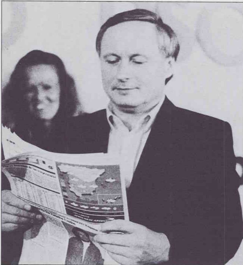
«Avui per avui, els problemes essencials només es poden resoldre en l'àmbit internacional.»

O.L.- En realitat, això ja s'està donant. El fet que avui les relacions entre les dues Alemanyes han millorat considerablement ja és conseqüència d'això. Això no seria possible sense la presència de Gorbatxov. No cal perdre de vista que els alemanys orientals tenen les seves dificultats amb Gorbatxov. Sembla que el «glasnost» i la «perestroika» és més fàcil dur-los a la pràctica a Sibèria que a l'Alemanya Oriental.