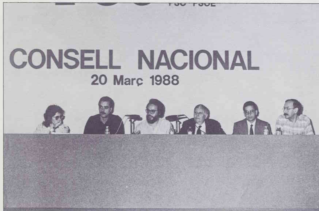
La mesa del Consell Nacional que va elegir els homes i les dones que representaran els socialistes a les properes eleccions al Parlament de Catalunya.