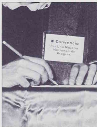
Una convenció d'homes i dones que volen participar en la definició del nostre futur col·lectiu encetant una iniciativa de debat i de diàleg.

El coneixement del català és quasi absolut. Un 80 per cent diu que el parla i l'escriu mentre que un 15 per cent assenyalava que l'entén i el parla.